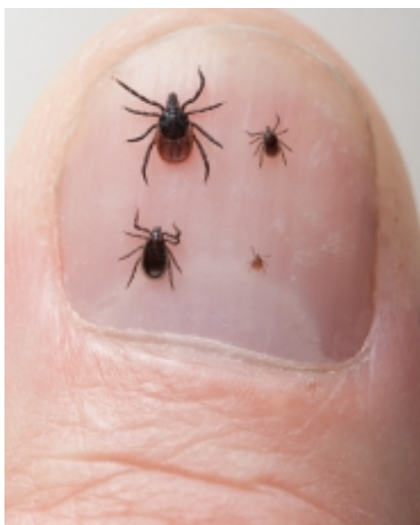
Teken op een duimnagel: van links naar rechts en van boven naar beneden: volwassen vrouwtje, nimf, volwassen mannetje, larve.

Als besmette teken mensen bijten, dan kunnen zij de bacterie Borrelia overbrengen. Deze bacterie veroorzaakt de Ziekte van Lyme. De schadelijke gevolgen voor de gezondheid kan variëren van licht tot ernstig. Aandacht voor preventie en tijdige behandeling is daarom van belang.