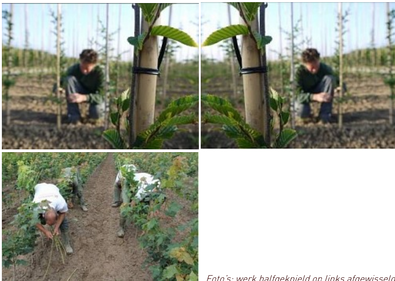
Foto's: werk halfgeknield op links afgewisseld met halfgeknield op rechts en varieer dit met werken vanuit stand waarbij het gewicht van het bovenlichaam afgesteund wordt op de knieën.