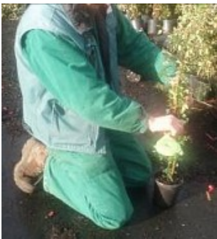
Foto's: Kruipen of knielen: belast de knieën, vaak ook de rug.