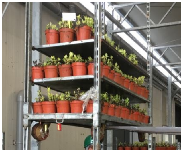
Hele Deense karren stapelen zonder koppelstang.