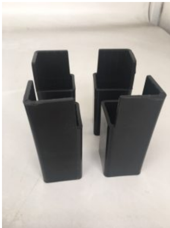
Foto: Stapelen halve Deense karren met stapelblokken (koppelstukken).