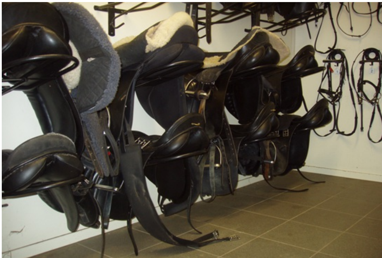
Foto: verrijdbare zadelkar