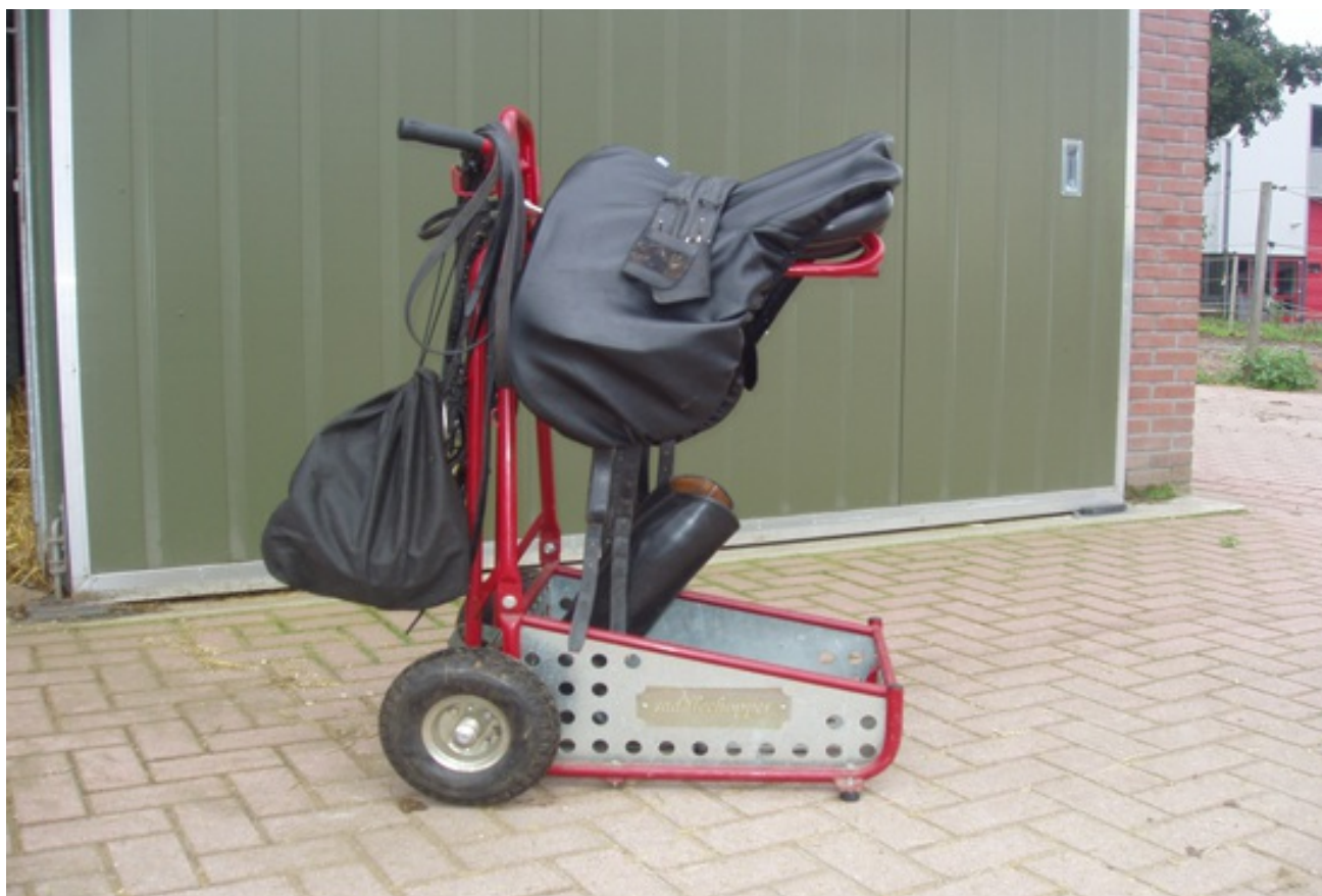
Foto: Zadelkamer, ponyzadels onderin