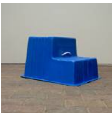
Foto: Opstapje voor gebruik in zadelkamer of als opstaphulp bij het opstijgen

Zadel tillen vanaf de grond Tillen vanuit de rug