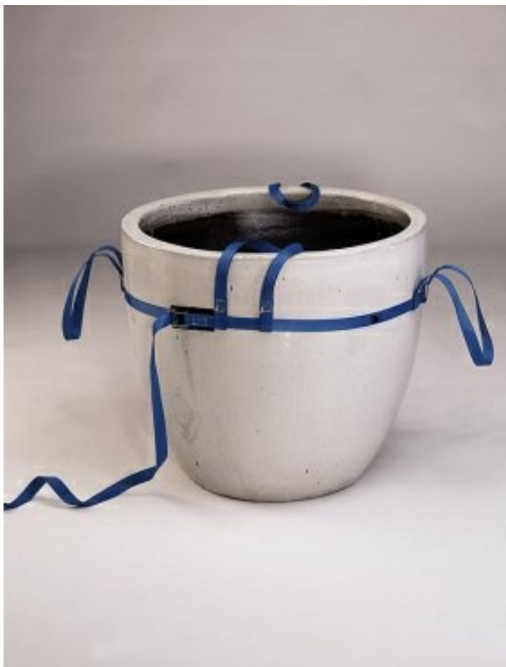
Tilband voor grote potplanten.